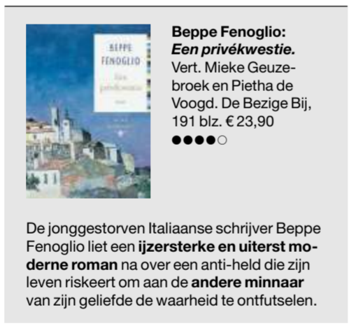
De jonggestorven Italiaanse schrijver Beppe Fenoglio liet een ijzersterke en uiterst moderne roman na over een anti-held die zijn leven riskeert om aan de andere minnaar van zijn geliefde de waarheid te ontfutselen.

Maar met alle verwijzingen naar het ridderlijke epos is Een privékwestie toch een uiterst moderne roman, met zijn eenvoudige, rake stijl en zijn typisch 20ste-eeuwse antiheld, die uiteindelijk niet rondwerft om iets in handen te krijgen, maar om iets te weten te komen.